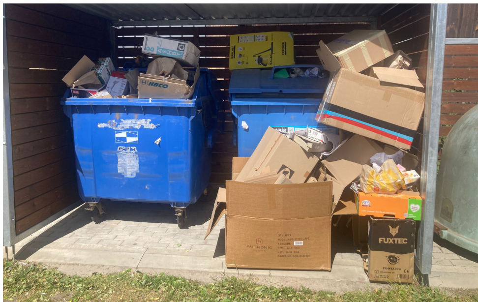
Kontejnerové stání na návsi

Zasedání zastupitelstva bylo ukončeno v 19:30.